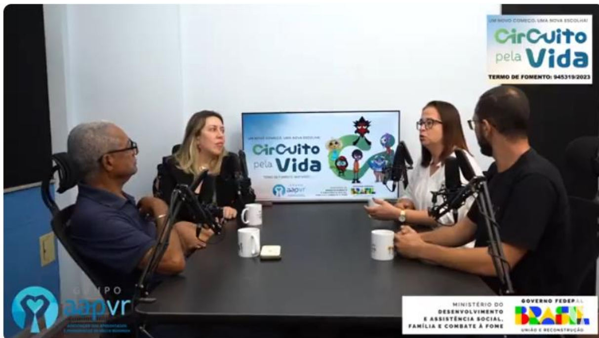
AAPVR e fortalecimento: Geraldo Vida - Episódio #26 - Circuito pela Vida